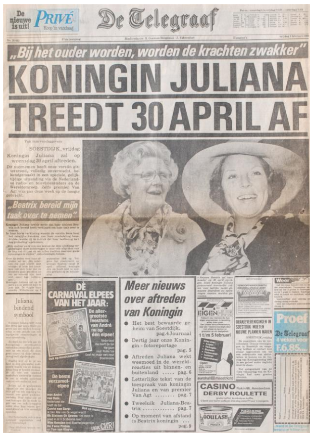
De Telegraaf van vrijdag 1 februari 1980.

Op 28 januari 2013 maakte koningin Beatrix haar aftreden bekend en dat gebeurde net zo onverwacht als koningin Juliana 33 jaar min 3 dagen eerder haar abdicatie bekendmaakte.