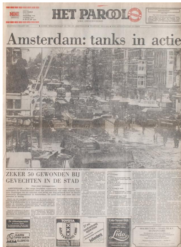
Het Parool van maandag 3 maart 1980.