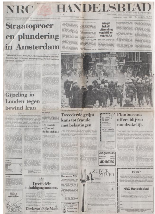
NRC Handelsblad van donderdag 1 mei.

De kranten hebben nog de hele maand mei over deze dag en de nasleep ervan gepubliceerd, aanvankelijk met aanvullende berichten, later meer met beschouwingen. Op 30 mei was een van de laatste voorpaginaberichten te lezen, toen door de politierechter vonnis was gewezen voor het gooien met stenen naar de