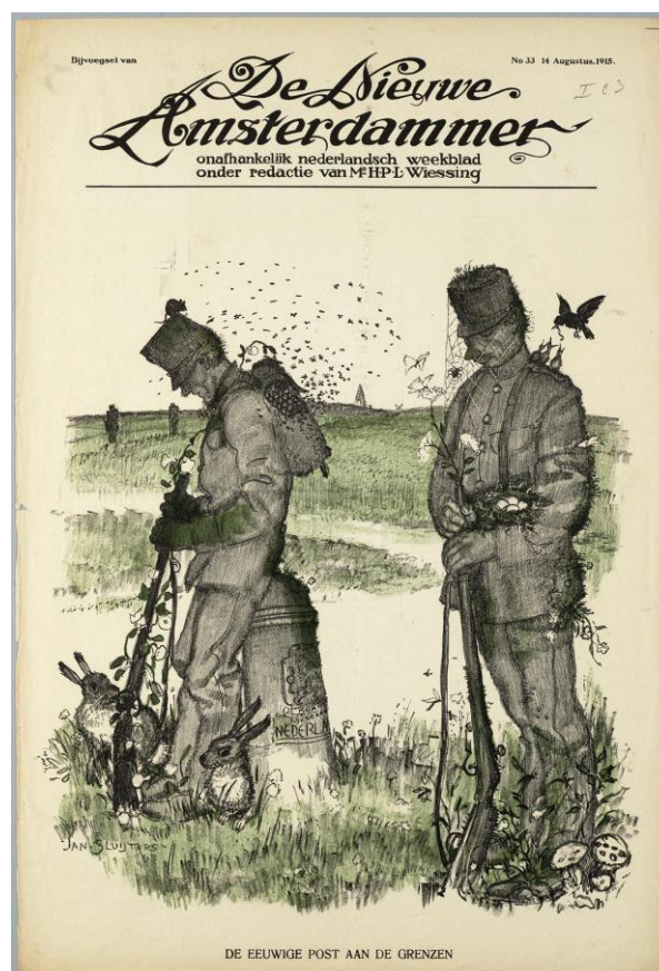
Tekening van Jan Sluijters op de cover van De Nieuwe Amsterdammer van 14 augustus 1915.

oorlog uitbrak. Spaarrekeningen werden in allerijl leeggehaald, bang als men was om de spaarcenten te verliezen. Eigen Haard gaf daarop een 'lesje economie' in maar liefst elf pagina's, aangevende dat "Wie zilvergeld oppot doet, speciaal in dezen tijd, een anti-sociale daad. Degenen die het deden hebben de regeering gedwongen tot de uitgifte der zilverbons [...] Wij hebben allen in deze moeilijke tijden een onafwijsbare plicht: zoo rustig en kalm mogelijk te zijn en vóór alles aan het algemeen belang te denken, in plaats van egoïstisch een voordeel trachten te behalen op onze medemenschen." Geen sensatie dus, maar een enigszins afstandelijke journalistieke stijl. De licht belerende stijl van het journalistieke bedrijf in Nederland was bijzonder ge-