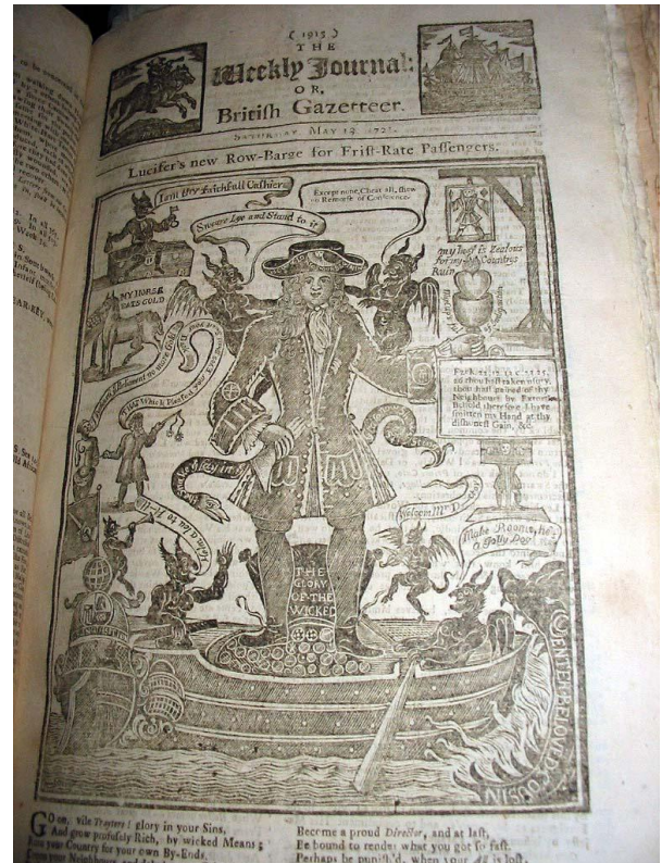
Spotprent op de windhandel.

– Meer nummers van de British Police Gazette or Irish Hue and Cry , vooral eind 18de eeuw (ik heb er pas één, van 1812).